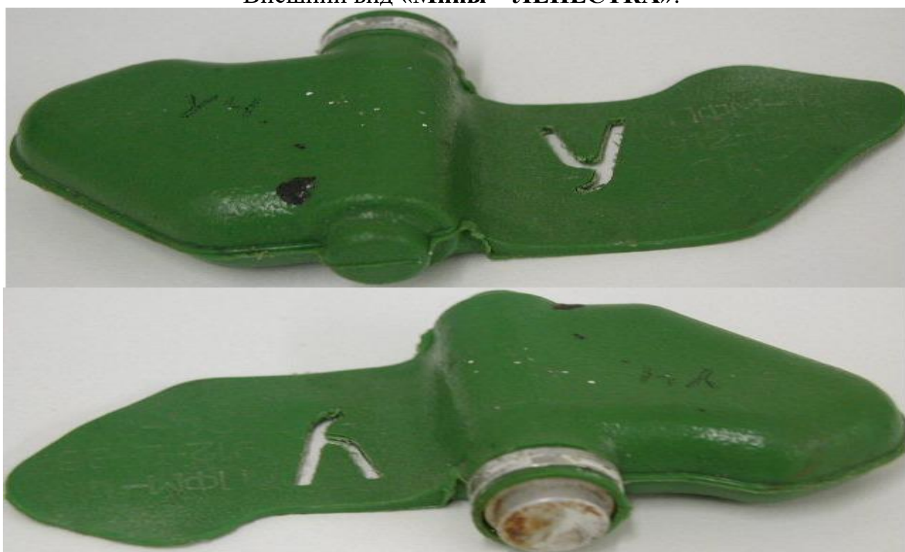
Внешний вид « Ми́ны – ЛЕПЕСТКА »:

Масса мины 80 грамм, размеры – 12 x 6 сантиметров, чувствительность мины лежит в пределах 5-25 кг, что вполне достаточно для срабатывания от веса маленького ребенка.