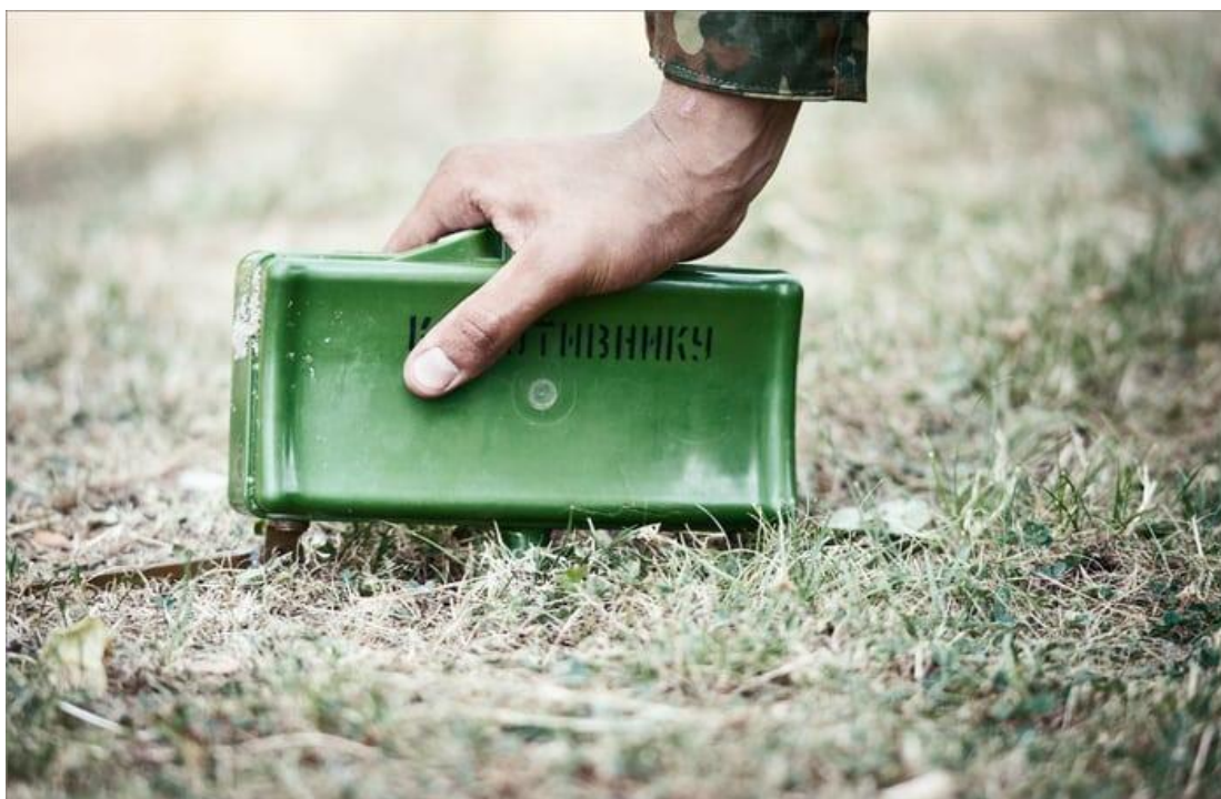
Мина в боевом положении